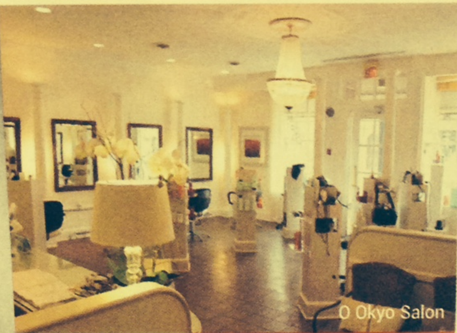
O Okyo Salon